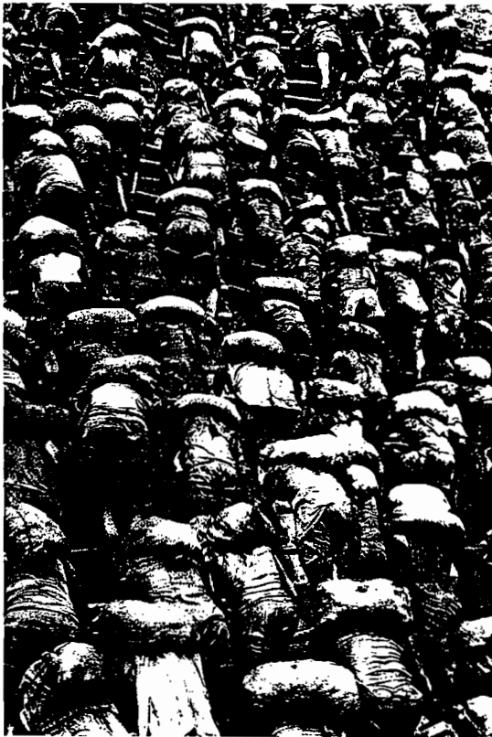
Sebastião Salgado. Almes d'or de la Serra Pelada, Brésil, 1986 Paris, agence Magnum